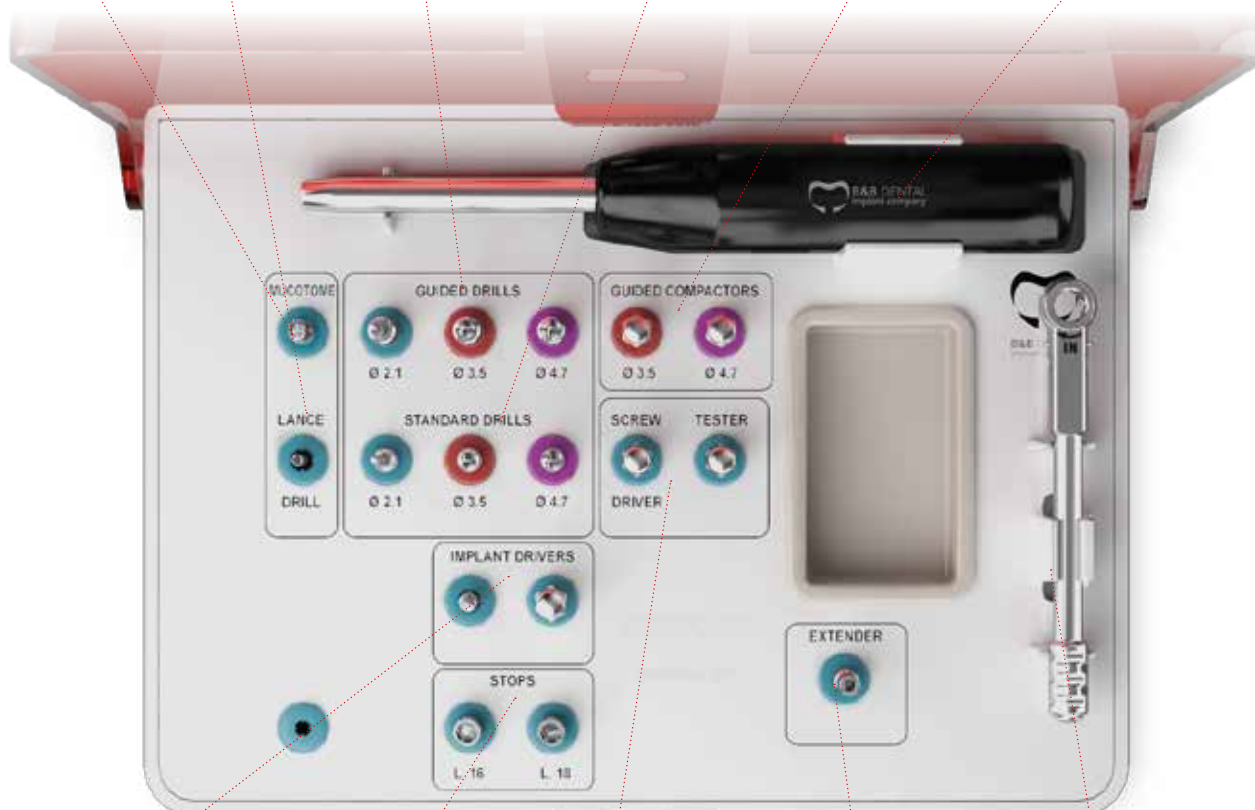
ПРЯМОЙ МАНУАЛЬНЫЙ КЛЮЧ 3P-00090CM