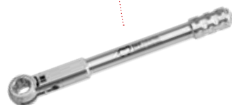
ИМПЛАНТОВОД INN-00581/L INN-00590/2